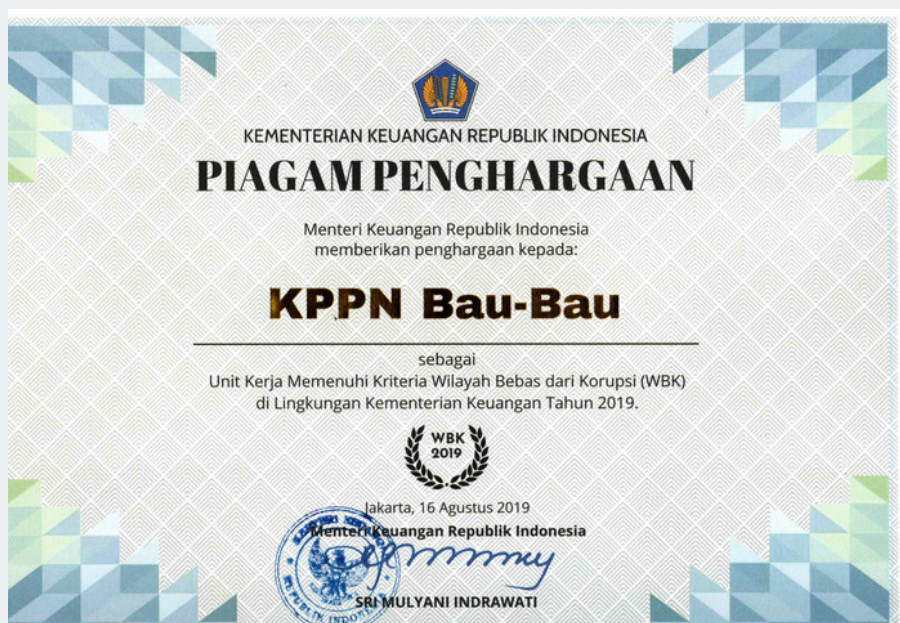
"Predikat WBK Tahun 2019"