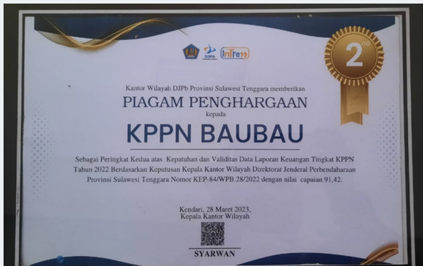
"Peringkat Kedua atas Kepatuhan dan Validitas Data Laporan Keuangan Tingkat KPPN Tahun 2022"