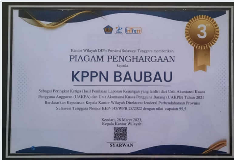
"Peringkat Ketiga Hasil Penilaian Laporan Keuangan tingkat UAKPA dan UAKPB Tahun 2021"