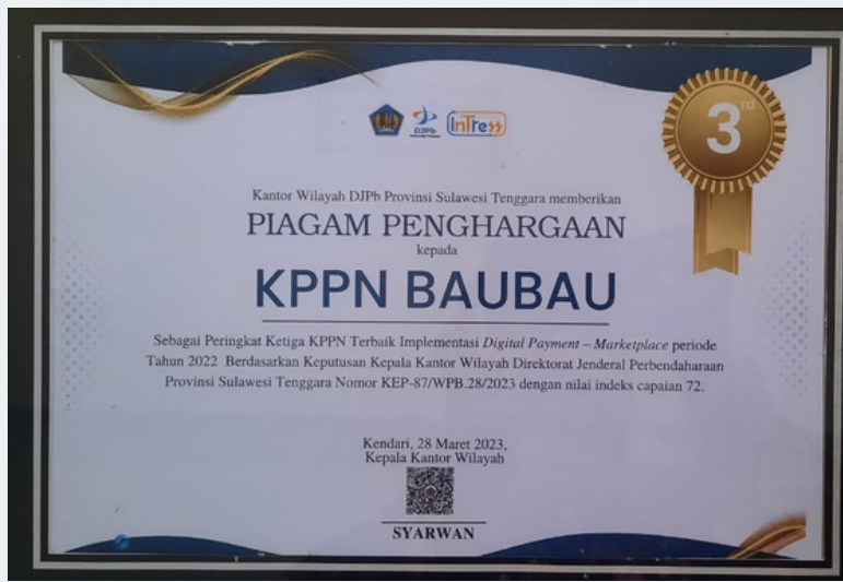
"Peringkat Ketiga KPPN Terbaik Implementasi Digipay - Marketplace Periode Tahun 2022"