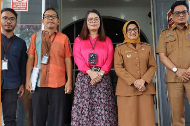
Kunjungan ke Kantor Walikota Pematangsiantar