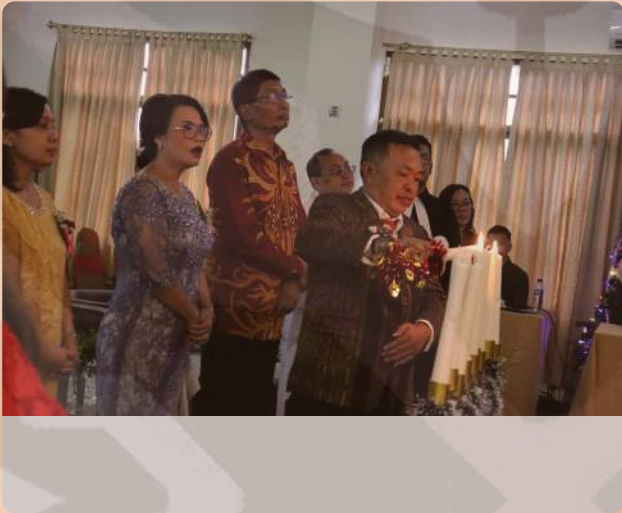
Perayaan Natal Kemenkeu Satu Kota pematang Siantar