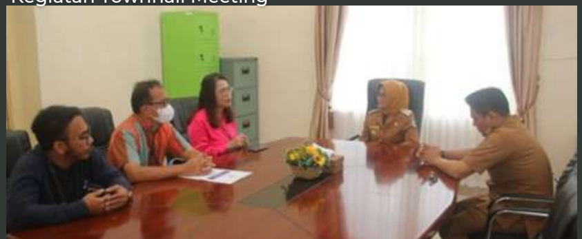
Kunjungan ke Kantor Walikota Pematangsiantar