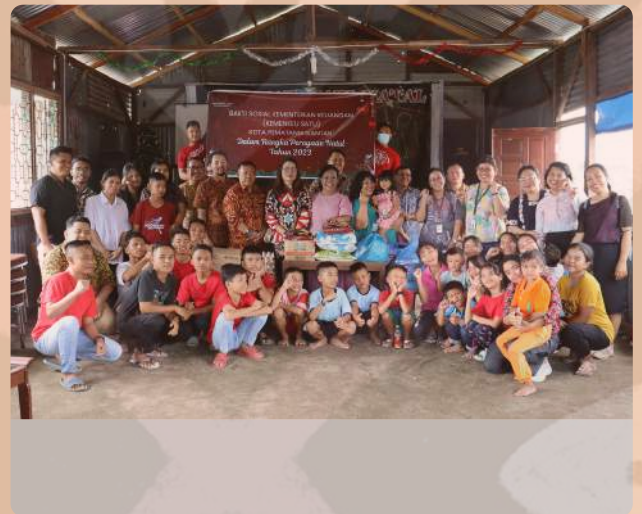
Bakti Sosial Kemenkeu Satu Kota Pematang Siantar