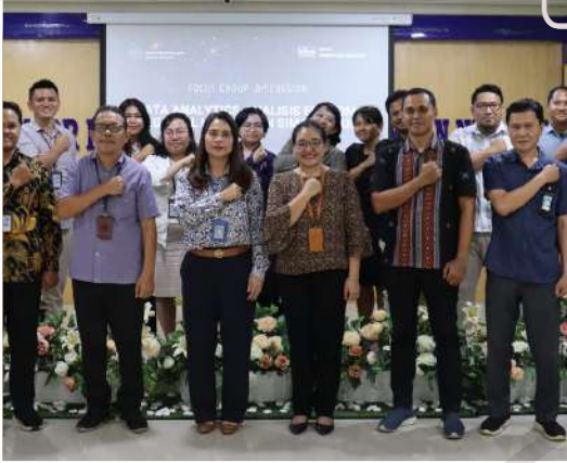
22 FEBRUARI 2024 FGD Data Analytics bersama BPS SIMALUNGUN