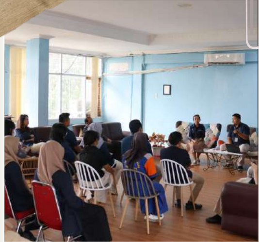
15 FEBRUARI 2024 Kegiatan Sortali Bulan Februari 2024