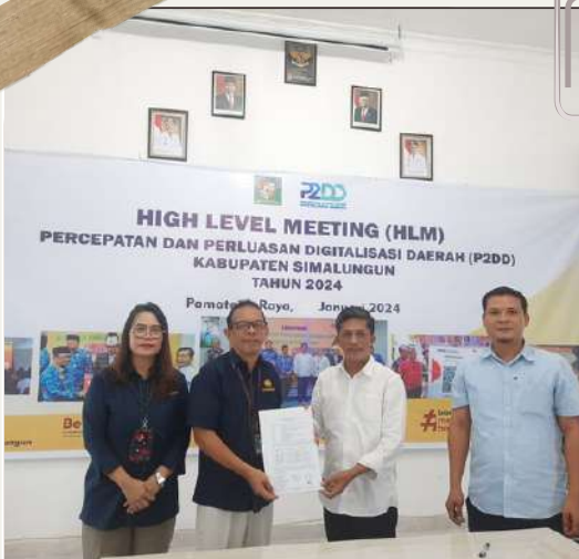
28 FEBRUARI 2024 Penandatanganan BAR bersama BPKAD Simalungun