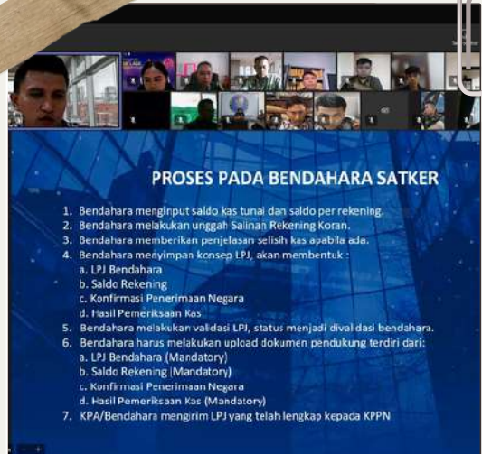
29 FEBRUARI 2024 Sosialisasi Penyusunan LPJ Bendahara melalui aplikasi SAKTI