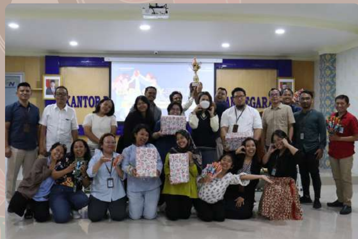
Triwulan I Capacity Building