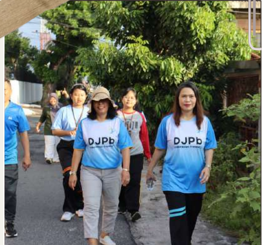
16 FEBRUARI 2024 Olahraga Jalan Sehat Bersama