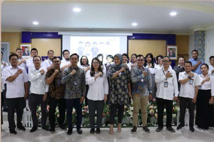
Triwulan I Service Excellent