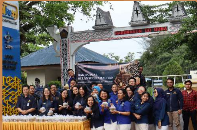
Acara Buka Bersama di KOREM-022/PT DAM-1/BB