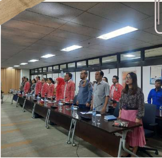
29 FEBRUARI 2024 High Level Meeting TPID Kota Pematangsiantar