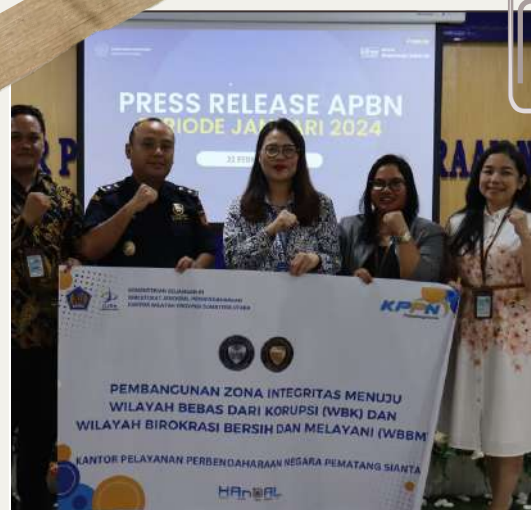
22 FEBRUARI 2024 PRESS RELEASE APBN, APRESIASI, SOSIALISASI ANTIKORUPSI & UMKM