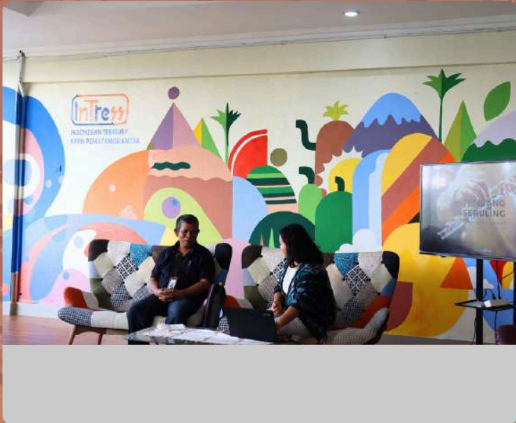
Sortali (Sharing Our Reaction and Talking about Integrity)