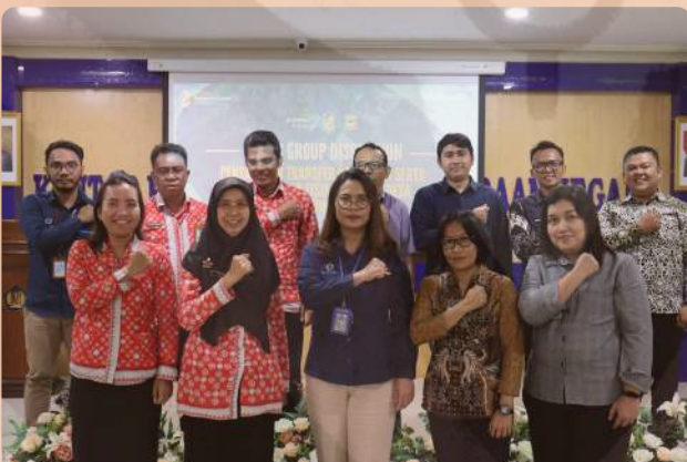
FGD Dak Fisik dan Dana Desa