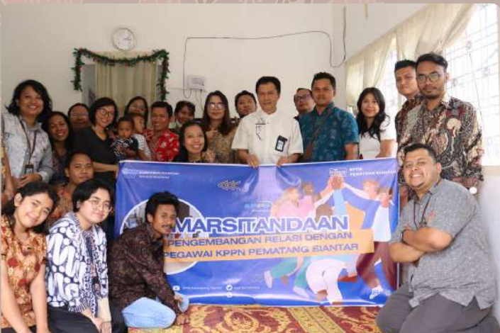
MARSITANDAAN Triwulan I