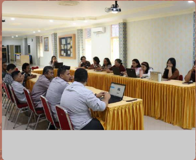
Gugus Kendali Mutu