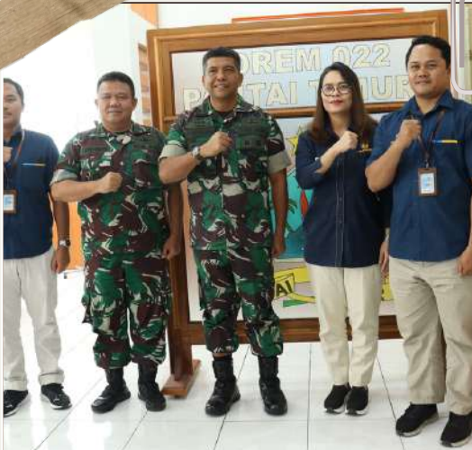
15 FEBRUARI 2024 Koordinasi Rakorwil bersama Korem 022/Pantai Timur