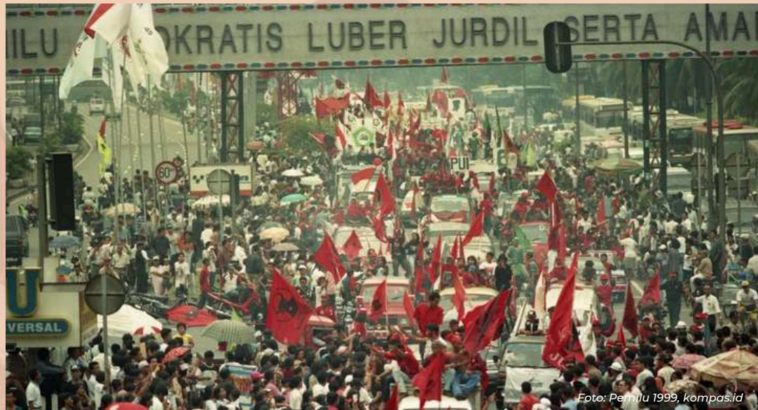
Foto: Pemilu 1999

merupakan investasi dari tatanan kehidupan berpolitik dan demokrasi di Indonesia, sehingga keberhasilan Pemilu 2024 ini diharapkan akan menghasilkan suksesi kepemimpinan nasional dan daerah yang legitimate serta stabilitas politik ini tentu menjadi garansi bagi pembangunan nasional di berbagai sektor.