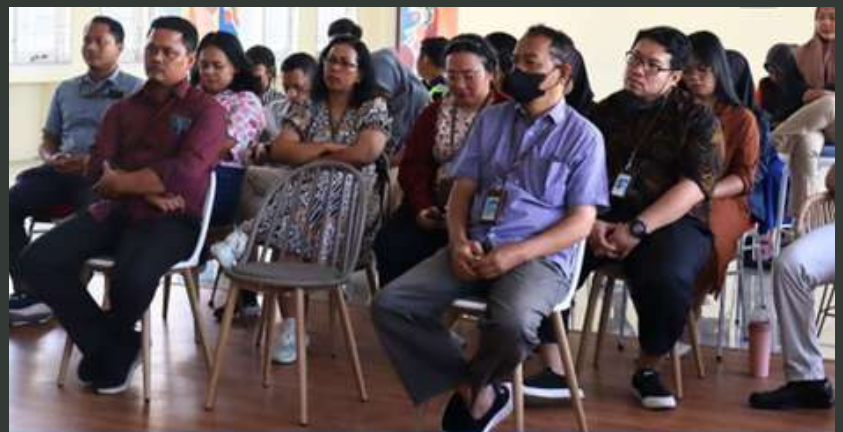
Kegiatan Townhall Meeting